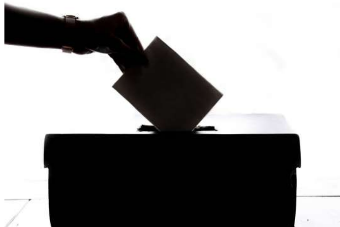
Las familias votamos el 17 de noviembre

Como viene siendo tradicional en el centro, a lo largo de la última semana de octubre se trabajó el origen de la festividad de Halloween, así como el día de todos los santos y difuntos en España, en todos los niveles. Se decoraron las clases, sonaban canciones, hicieron manualidades... Y el viernes 29 de octubre el alumnado acudió disfrazado al centro y participó en las postas instaladas en uno de los patios. .