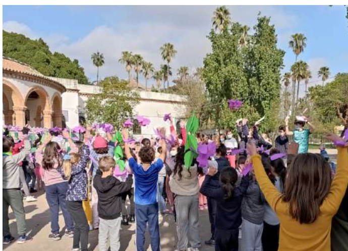
Lazos violetas en las manos y violencia cero contra la mujer

Ya se han renovado los cargos del Consejo Escolar del CEIP España. En esta ocasión, las familias contamos con cinco madres de diversos cursos que nos representan (el máximo según el número del alumnado). Este órgano junto al AMPA son las principales vías de participación de las familias en la vida de los centros educativos, herramientas legítimas, transformadoras y muy necesarias. .