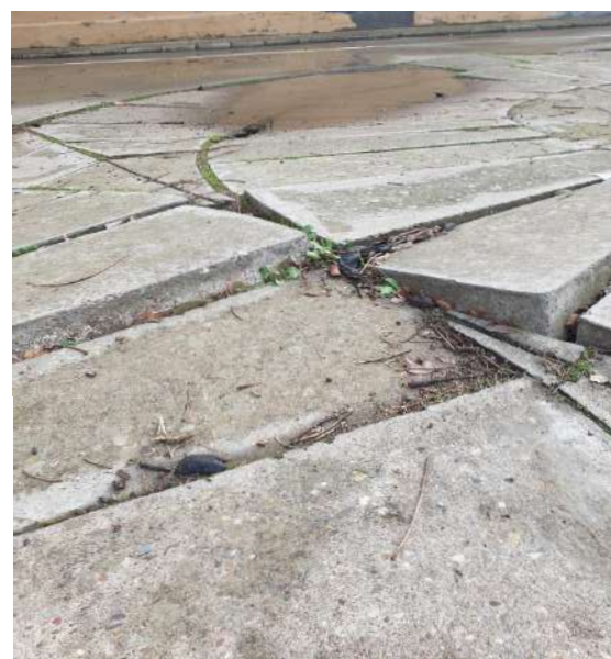
El mal estado del pavimento del "Patio de Primaria" provoca múltiples caídas en el alumnado que ha sufrido contusiones y hasta pérdida de piezas dentales

Así que, tal y como hicimos con el comedor, volveremos a "levantarnos y luchar" con el fin de que el Ayuntamiento de Sevilla (que es la administración competente en este sentido) repare y acondicione los patios de nuestro cole. De ello se encargará la Comisión de Infraestructuras pero seguro que vamos a necesitar de toda la fuerza de las familias. Así que, si quieres sumarte a nuestro "plan estratégico" de los patios, escríbenos a ampaparquedemarialuisa@gmail.com . Cuantas más familias seamos, más fuerza tendremos.