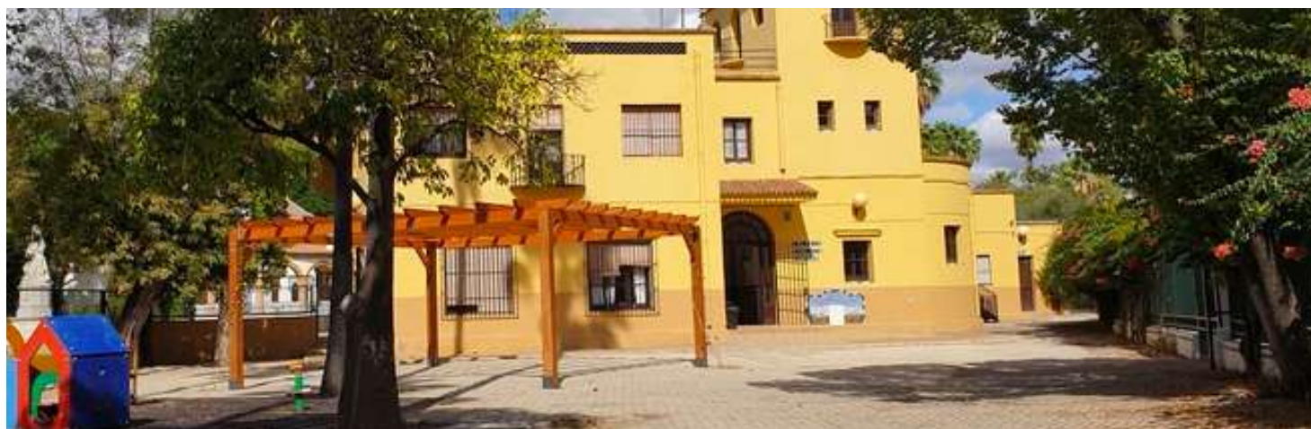
La pérgola del "Patio de Infantil" ni da sombra ni refresca