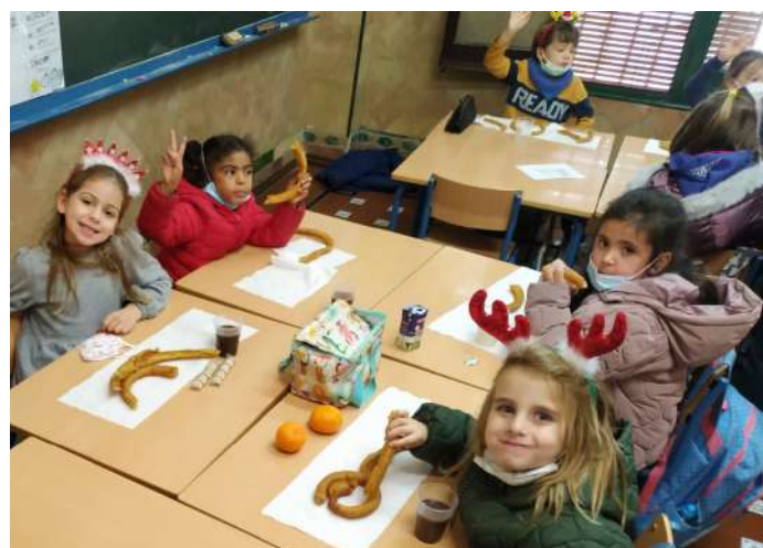
Tutoras y tutores repartieron el desayuno en cada clase

El jueves 25 de noviembre el alumnado del CEIP España celebró el Día Internacional de la Eliminación de la Violencia contra la Mujer. Se realizó al exterior, en la pista deportiva del patio, atendiendo a la normativa covid. Entre otras actividades, elaboraron una guirnalda con flores violetas y la llevaron al patio de Primaria donde se celebró el acto.