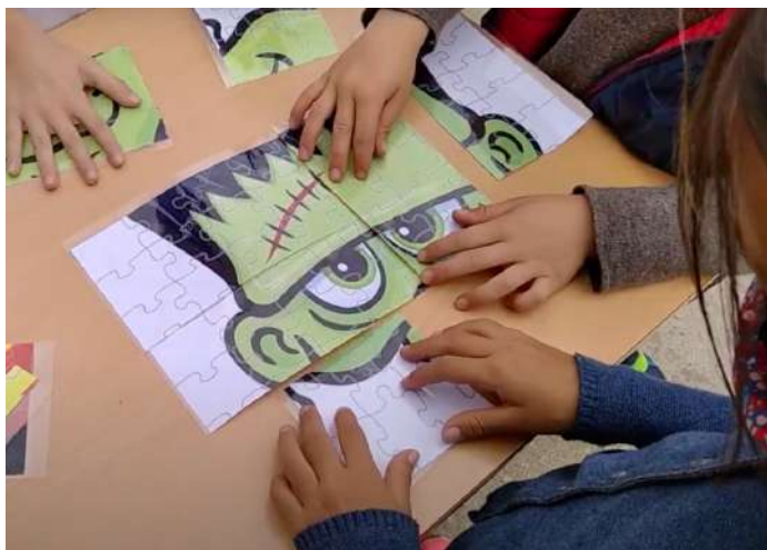
Lo pasaron de miedo..